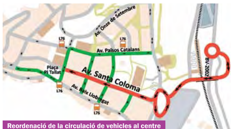
Reordenació de la circulació de vehicles al centre

El Pla de Mobilitat ha estat elaborat per tècnics especialitzats a través de la Diputació de Barcelona. Les propostes que plantejava l'estudi han estat presentades, obertes a la ciutadania i debatudes en diverses sessions participatives i finalment es va consensuar l'aplicació de l'opció que s'està posant en pràctica. ■