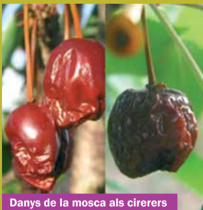
Danys de la mosca als cirerers

la plaga i reduir els danys sobre les collites, però encara no es té prou certesa de la millor forma d'atacar aquest insecte que malmet les cireres quan ja estan madures i provoca importants pèrdues de la collita. El que sí que cal tenir en compte és que caldrà actuar de forma global, tant als camps de cultiu professional, com els de lleure, fins i tot als camps abandonats, i també en parcel·les o jardins on es tinguin cirerers, per tal d'evitar que la plaga s'estengui i es multipliqui. ■