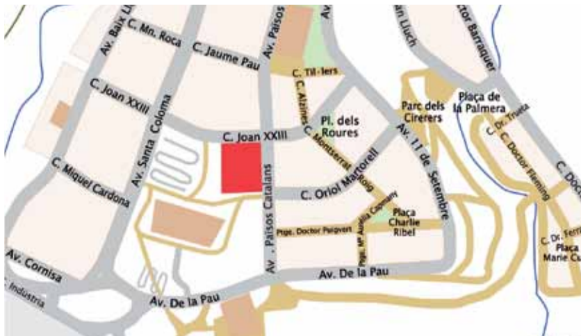
El futur CAP es construirà a l'Av. Països Catalans amb C/ Joan XXIII.

millorarà el servei ofert amb unes instal·lacions més adequades a les necessitats de la població de Santa Coloma. El nou edifici es construirà a la intersecció del carrer Joan XXIII amb l'Avinguda Països Catalans (grafiat al plànol en vermell). ■