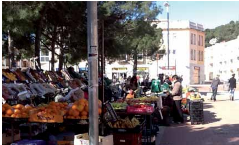
El nou mercat setmanal es situa cada dimecres a la Plaça del Pi Tallat.

Emmarcat en un projecte més ampli de Promoció Econòmica, el Mercat Setmanal de Santa Coloma es projecta com un complement necessari de l'oferta comercial de proximitat.