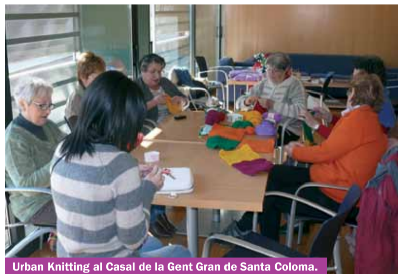
Urban Knitting al Casal de la Gent Gran de Santa Coloma.