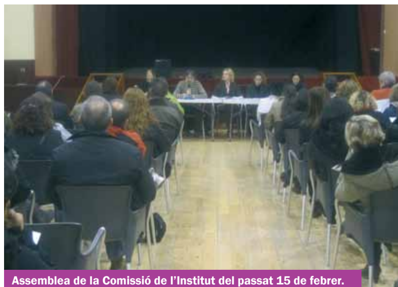
Assemblea de la Comissió de l'Institut del passat 15 de febrer.

Organitza: Ajuntament. Regidoria d'Esports | Consell Esportiu del Baix Llobregat (CEBLLOB) | Entitats esportives del municipi | Escoles del Municipi i AMPA'S - Amb el suport de Esport Català | Generalitat de Catalunya. Departament d'Educació.