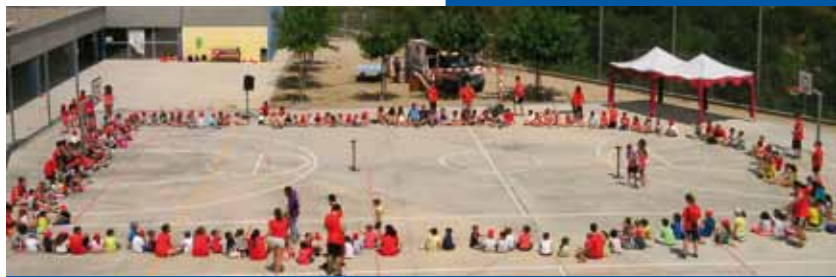
Casal Activa't a l'Escola Pla de les Vinyes.

57 famílies s'han pogut beneficiar del programa de beques que l'Ajuntament ha aprovat perquè infants de famílies amb dificultats econòmiques poguessin participar en els casals, amb una reducció del preu de fins al 50%.