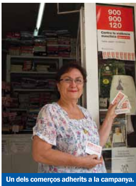
Un dels comerços adherits a la campanya.

vint silenciats perquè es donen en l'àmbit íntim de la llar i moltes dones encara no es decideixen a demanar ajuda. El comerç local, com a punt de trobada i comunicació entre el veïnat, s'ha convertit en un agent imprescindible en la lluita per eradicar aquesta xacra i brinda un aparador impagable per oferir un recurs de primera mà a les víctimes. ■