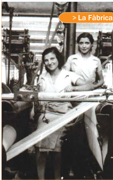
> La Fàbrica

A la filatura i als telers les dones no paraven ni un moment perquè anaven a preu fet, més metres, més sou. En les altres seccions podien seure i treballaven a un ritme més descansat. Inicialment es feien 12 i 14 hores diàries, 6 dies a la setmana i cobraven la meitat que un home, i només amb