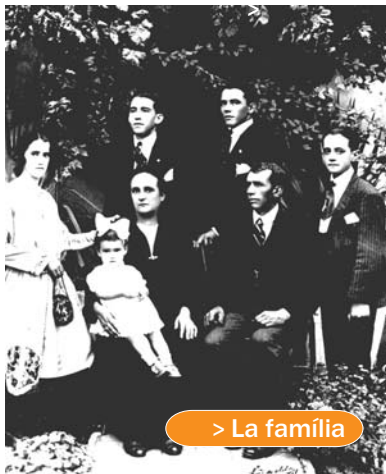
> La família

La seva és una casa típica de la Colònia. Abans el terra era de tova, s'escombrava sovint i es fregava amb salfumant dos cops l'any. Jardinet davant i eixida darrere, on criaven gallines, conills i on hi havia la comuna i el pou; a la planta baixa hi havia la cuina, menjador i una habitació; a dalt dues habitacions grans i una de petita.