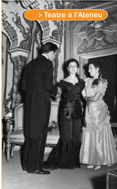
> Teatre a l'Ateneu