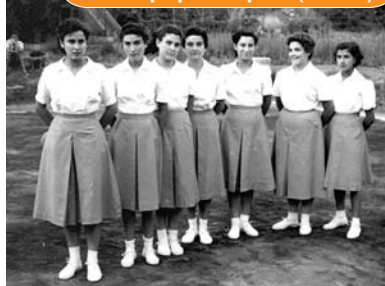
> Equip bàsquet (1953)

Al costat de l'església hi havia hagut pistes de bàsquet i de tennis, que pertanyien a la parròquia. Va haver-hi dos equips femenins de bàsquet, el primer fundat el 1953, el segon el 1967.