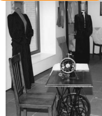
> Vestits Festa del Modernisme

El títol de modista conegut com a corte i confección implicava saber fer el patrons, tallar, emprovar i cosir.