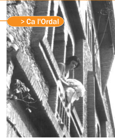
> Ca l'Ordal

Aquesta casa estava habitada per tres famílies pageses que treballaven les terres dels Güell com a arrendataris. Alguns membres de les famílies treballaven també a la fàbrica. La dona pagesa tenia cura de la casa, dels animals, de l'hort, de la família i, normalment, anava a plantar i a collir al camp. La funció de pagesos i pageses en